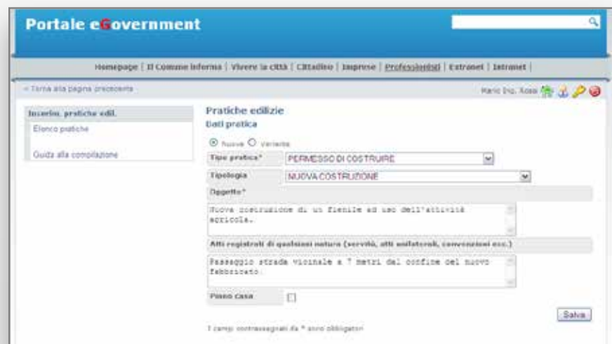
Fig. 12: esempio della schermata principale di un permesso di costruire.

Alla luce del modificato art. 117 del Titolo V della Costituzione, che ha attribuito alle Regioni autonomia legislativa anche in materia edilizia, la procedura permette di personalizzare ogni parametro, dalle descrizioni o codici alla scelta di quali tipi di atti da utilizzare, e di personalizzare l'istruttoria e i tempi per le scadenze di ogni fase.